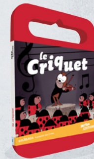
LE CRIQUET - 2 ANS