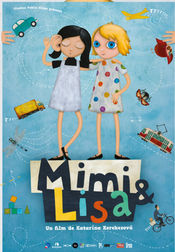
AFFICHETTE (format 40x60cm)