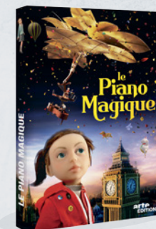
LE PIANO MAGIQUE 5/6 ANS