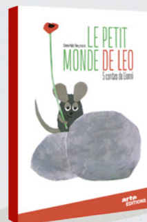
LE PETIT MONDE DE LEO 2 ANS