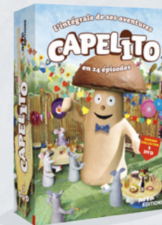
L'INTÉGRALE CAPELITO (3 DVD) 2 ANS