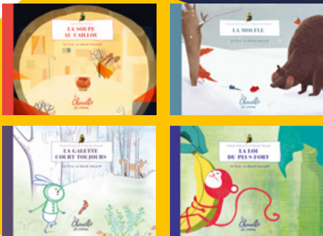
La collection de livres La Chouette du cinéma