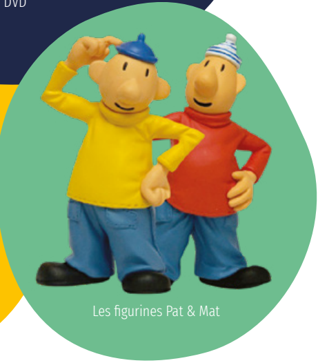
Les figurines Pat & Mat