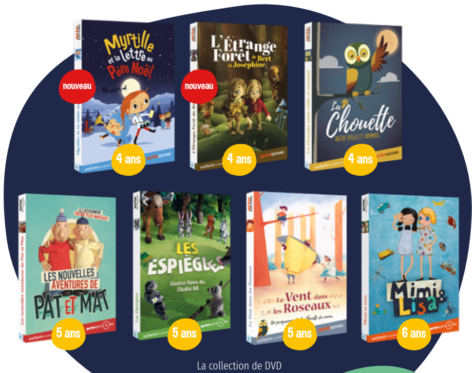
La collection de DVD

Retrouve tes films préférés en DVD ainsi que des livres et des goodies sur notre site www.cinemapublicfilms.fr